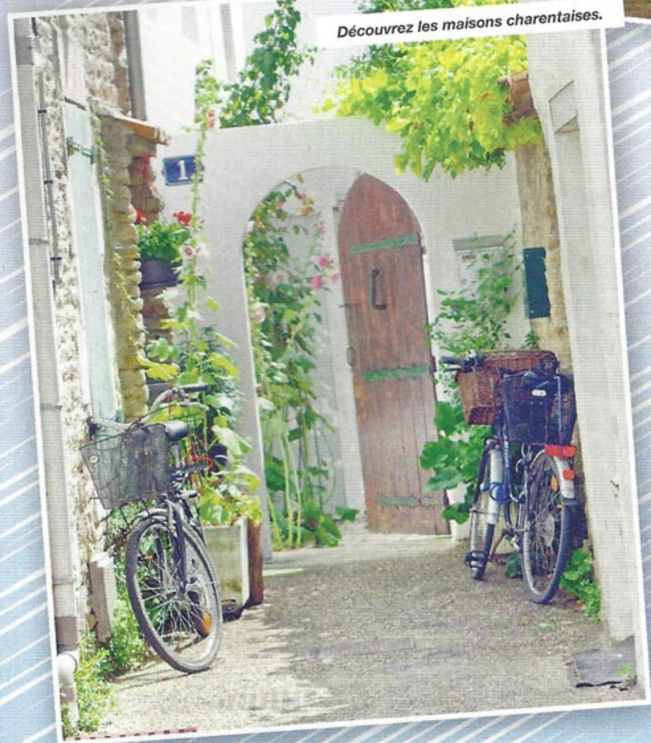
Découvrez les maisons charentaises.

Au départ du village de Saint-Loup, en face du terrier de Mugon, moyennant un petit détour, vous admirerez un corps de garde à l'orée du bois. Vous poursuivrez votre route vers Saint-Laurent-de-la-Barrière, un des plus petits villages du département, avec son église romane du XII e siècle. Vous découvrirez au fil du parcours de belles maisons charentaises, des lavoirs, des moulins à eau, et une vue panoramique à Puyrolland. Vous longerez les marais de Landes le long de la Trézence, jusqu'au pigeonier du grand Vivroux. Laissez-vous tenter par ce circuit typiquement charentais.