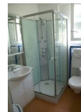
(Salle de bain)

Gîte CHÊNE 4 – T 4: 8 pers. «HOLLANDE» environ 80m 2 (séjour, salon avec banquette et télévision , cuisine aménagée , une chambre avec grand lit, une chambre avec 2 lits jumeaux, une chambre avec 2 fois 2 lits superposés, une salle de bains avec cabine de douche, vasque sur meuble et WC)